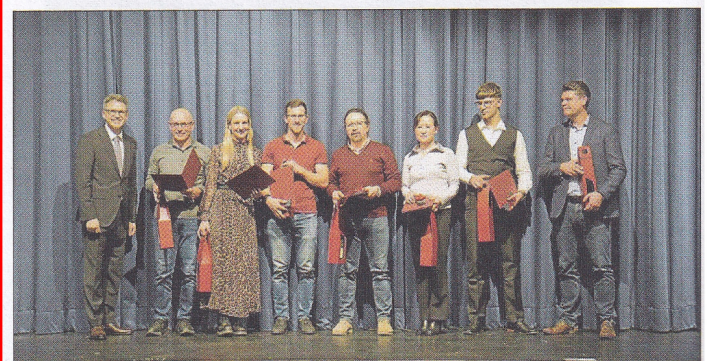
Die Geehrten für besondere sportliche Leistungen.

Im dritten Ehrungsblock standen sportliche Höchstleistungen im Fokus: