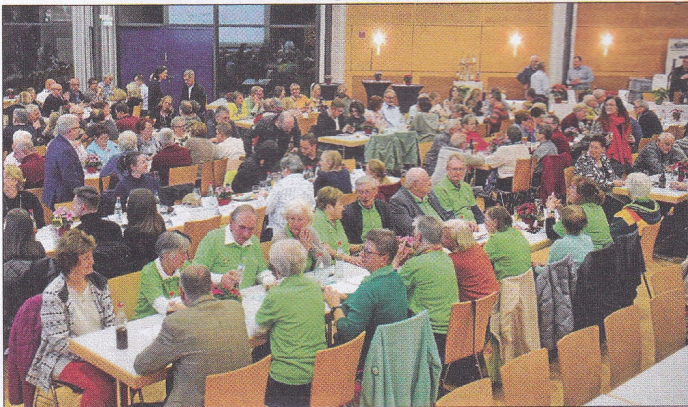
Ein Blick in den Kulturtreff.

Talheim – Der Bürgerabend am 23. November war ein besonderer Anlass, um 24 engagierte Bürgerinnen und Bürger Talheims zu ehren, die sich in Vereinen, Organisationen und durch sportliche Leistungen in besonderem Maße für die Gemeinschaft einsetzen. In einem abwechslungsreichen Programm wurden Ehrungen mit unterhaltsamen Beiträgen kombiniert und boten den Gästen einen stimmungsvollen Abend.