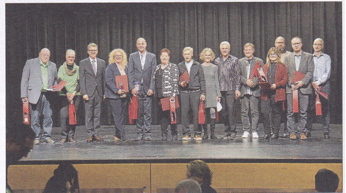
Die Geehrten des 2. Blockes mit den jeweiligen Laudatoren.

Der zweite Ehrungsblock zeichnete aktive Vereinsmitglieder folgender Institutionen aus: