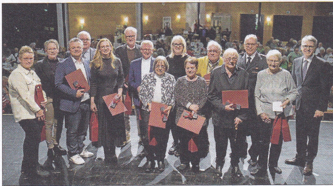
Im ersten Block wurden insgesamt 8 Bürgerinnen und Bürger geehrt, neben Ihnen stehen ihre Laudatoren.

Im ersten Ehrungsblock wurden folgende Personen für ihr herausragendes Engagement gewürdigt: